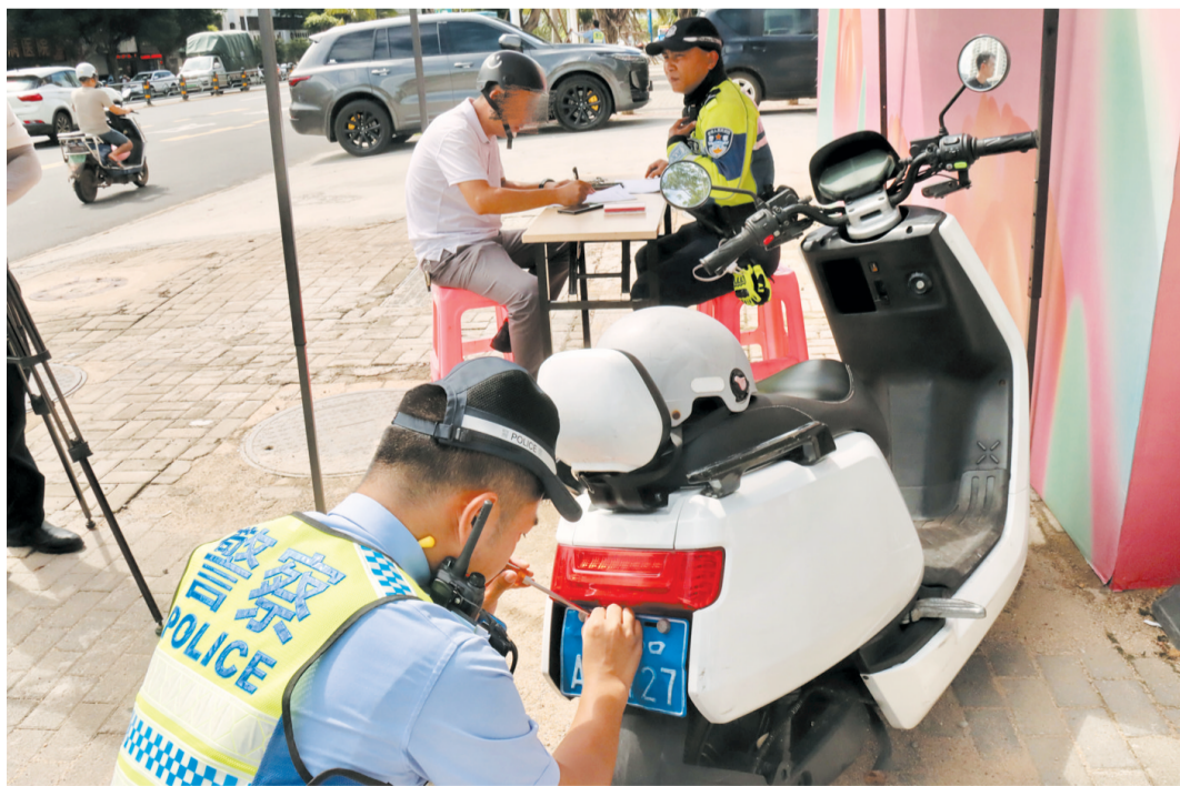
在8月16日的整治行动中,交警对悬挂过渡期蓝牌的车辆进行核查。

当天,执法现场还出现这样一幕:一名家长为躲避检查,竟让未佩戴安全头盔的孩子下车在路边随车奔跑。自己则骑车快速通过路口。“这种‘规避处罚’的行为,将孩子置于危险的车流中,极易引发交通事故。”执勤交警立即上前将孩子护送至安全区域,并对家长进行了严肃的批评教育。