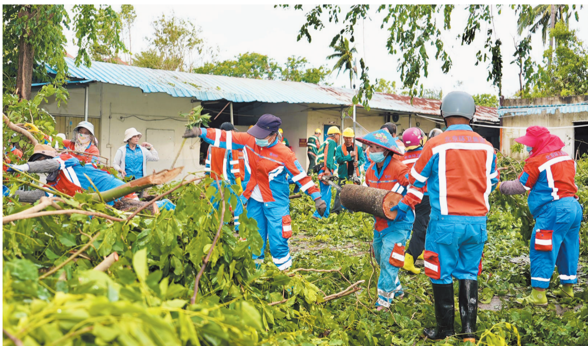
8月26日,在三亚市天涯区海榆西线桶井路段,海口支援三亚工作组人员正在清理被台风吹倒的树木。

8月26日上午,台风“剑鱼”过境后的三亚街头,仍可见路边倒伏的树木。但随着灾后恢复工作的不断推进,一条座城市动脉很快被打通。在灾后恢复的关键时刻,海口支援队昼夜驰援,在三亚一些重点路段冒险清障,用汗水和热情守护城市整洁与安宁。 □本报特派记者 李欣