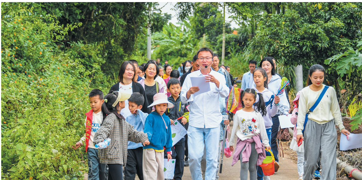
▲12月28日，在龙华区遵谭镇龙合村村委会卜商村，市民游客在徒步中感受田园风光。