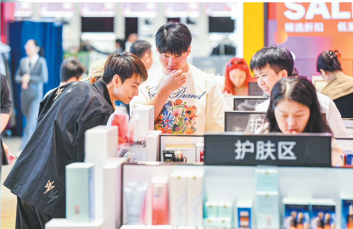
11月30日,在cdf海口国际免税城内,消费者正在选购免税商品。

“新政实施首月,离岛免税销售提货单量稳步增长,显示出新政对消费的强劲拉动作用。”海口海关口岸监管处相关负责人表示,海口海关将继续推动海南免税产业向新向好发展,全面提升监管效能,让旅客充分享受离岛免税政策红利,为加速推进海南国际旅游消费中心建设贡献海关力量。