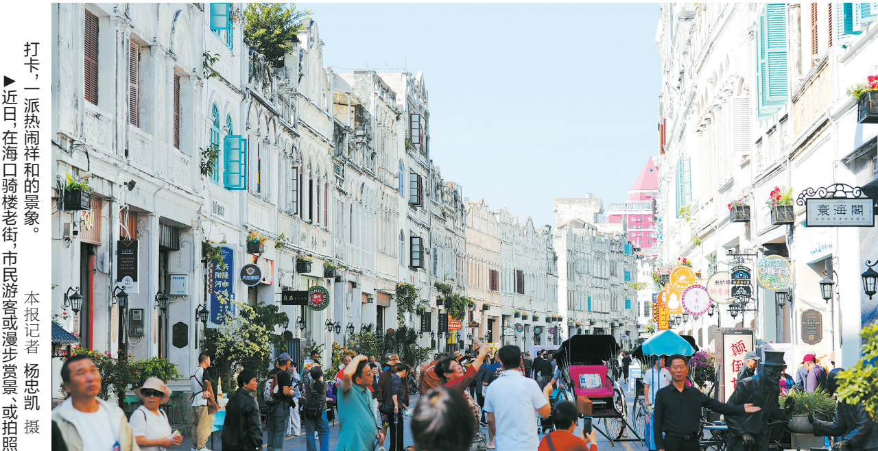
打卡，一派热闹祥和的景象。近日，在海口骑楼老街，市民游客或漫步赏景、或拍照

口市政府2010年启动的保护综合整治工程。该工程采用“一栋一策”精细化方案，修缮490栋骑楼建筑立面，并铺设现代化水电、消防及智慧管理系统。同时，通过精准业态规划，将一度破败失修的历史建筑“负资产”，激活为“可消费、可体验、可住宿”的文化旅游“活资产”。