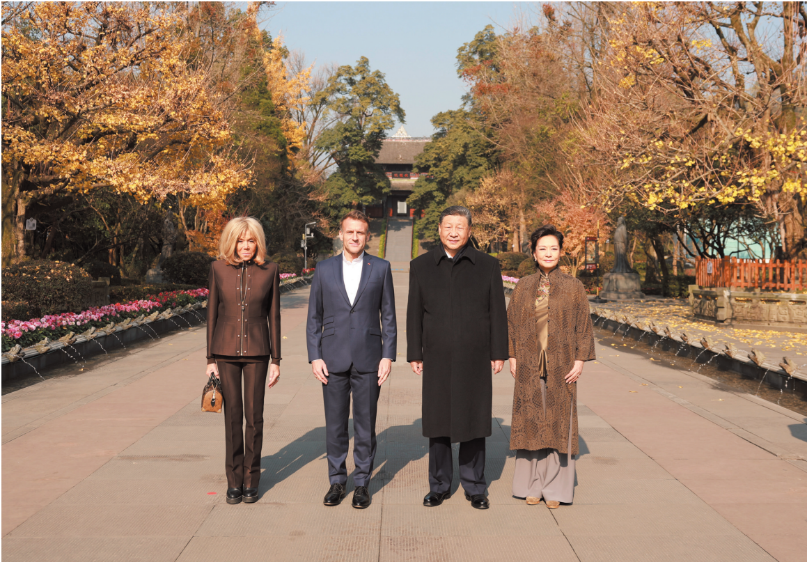
12月5日，国家主席习近平在四川省成都市都江堰同法国总统马克龙进行友好交流。这是习近平和夫人彭丽媛同马克龙夫妇合影。

新华社成都12月5日电（记者孙奕 吴光于）12月5日，国家主席习近平在四川省成都市都江堰同法国总统马克龙进行友好交流。