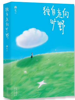
《独自走向旷野》 作者:燕七 出版社:长江文艺出版社