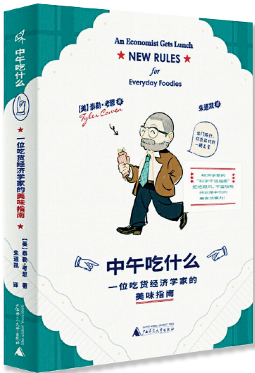
《中午吃什么》 作者:泰勒·考恩[美] 出版社:广西师范大学出版社

每天中午十一点,办公室里开始弥漫一种熟悉的焦虑——“中午吃什么?”这个看似简单的问题,却让无数都市人陷入选择困难。就在我们对着外卖软件刷到手指发麻时,一位美国经济学家带来了一份独特的觅食指南。