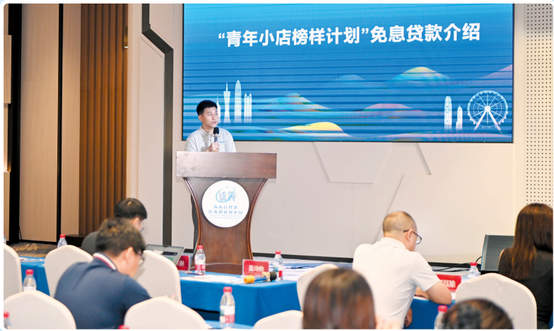
▲海口青年创业扶持政策大讲堂为青年创业群体带来帮助。

青年与城市,从来都是一场双向奔赴。海口以城市的温度与力度向青年敞开机遇之门,未来更需以系统思维和生态视角,推动青创服务从“有感”向“有效”持续深化,奏响青年与城市共鸣共进的崭新篇章。