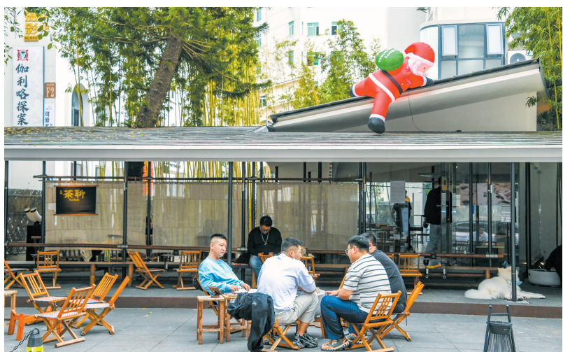
▲几名年轻人在青年创业者经营的新中式茶饮店品茶。

这样的孵化基地在海口已星罗棋布。截至目前,全市已建成市级创业孵化基地14家,形成“综合孵化器+特色众创空间+高校创业园”的载体网络,累计孵化企业超600家。