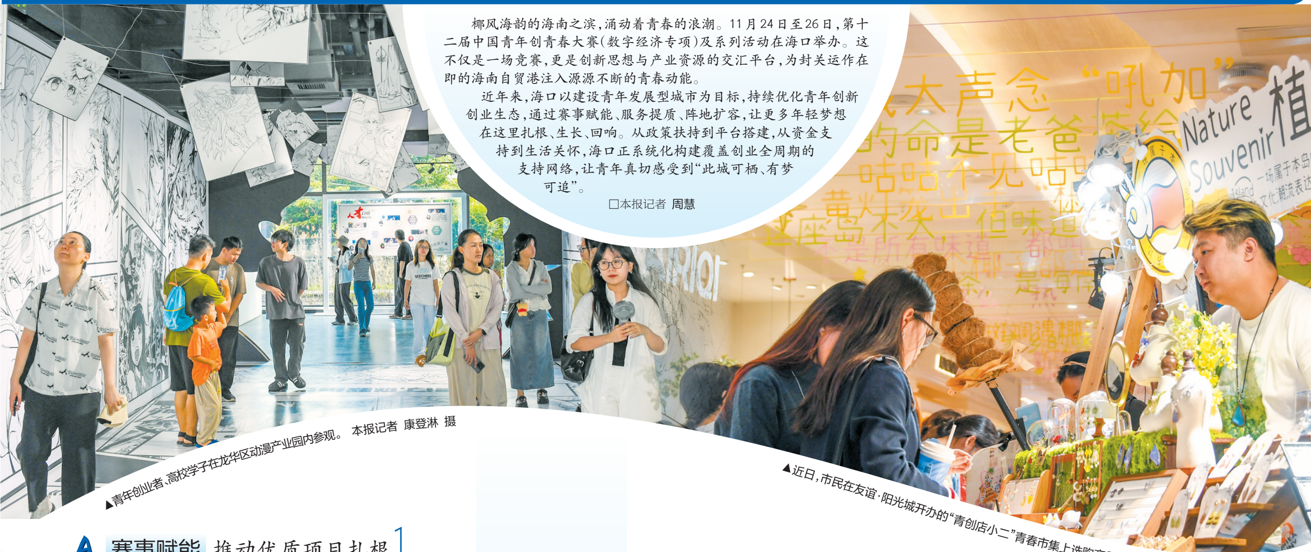
▲青年创业者、高校学子在龙华区动漫产业园内参观。