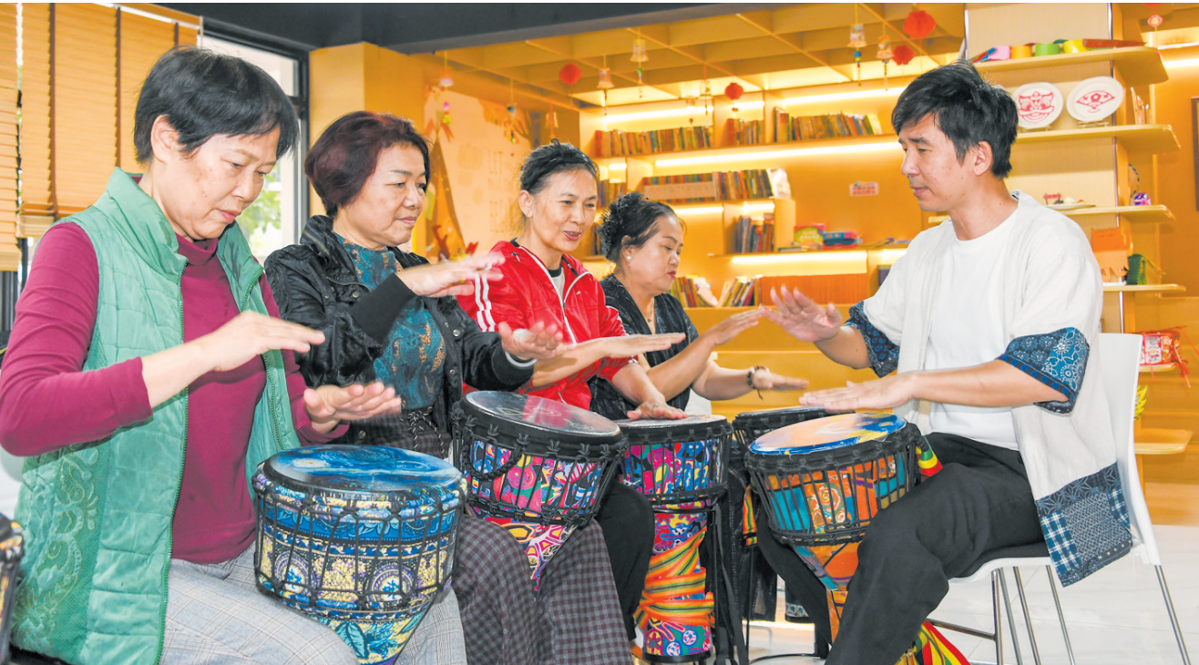
12月9日,在海德豪庭小区党群服务驿站,居民在老师带领下认真练习非洲鼓,现场气氛欢乐融洽。