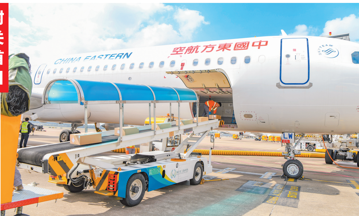
12月18日，在海口美兰机场，一批海关监管“二线”内销加工增值免关税货物正在运上飞机。