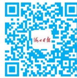
海口日报微信公众号 新闻随时看