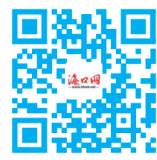
海口网 更多新闻资讯