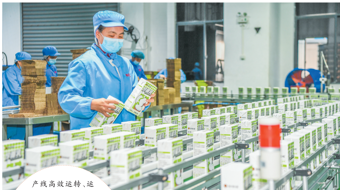
1月12日,海口椰彩食品有限公司生产车间内,工作人员在生产线上检查产品外包装。

产线高效运转、运输忙碌不停……1月12日,位于海口国家高新区狮子岭工业园的海口椰彩食品有限公司,处处洋溢着奋战新年“开门红”的火热氛围。作为深耕椰子加工饮品领域多年的海口本土企业,椰彩食品凭借特色产品优势,已成为众多一线茶饮品牌核心供应商,眼下正值市场旺季,企业开足马力,满负荷投入生产。