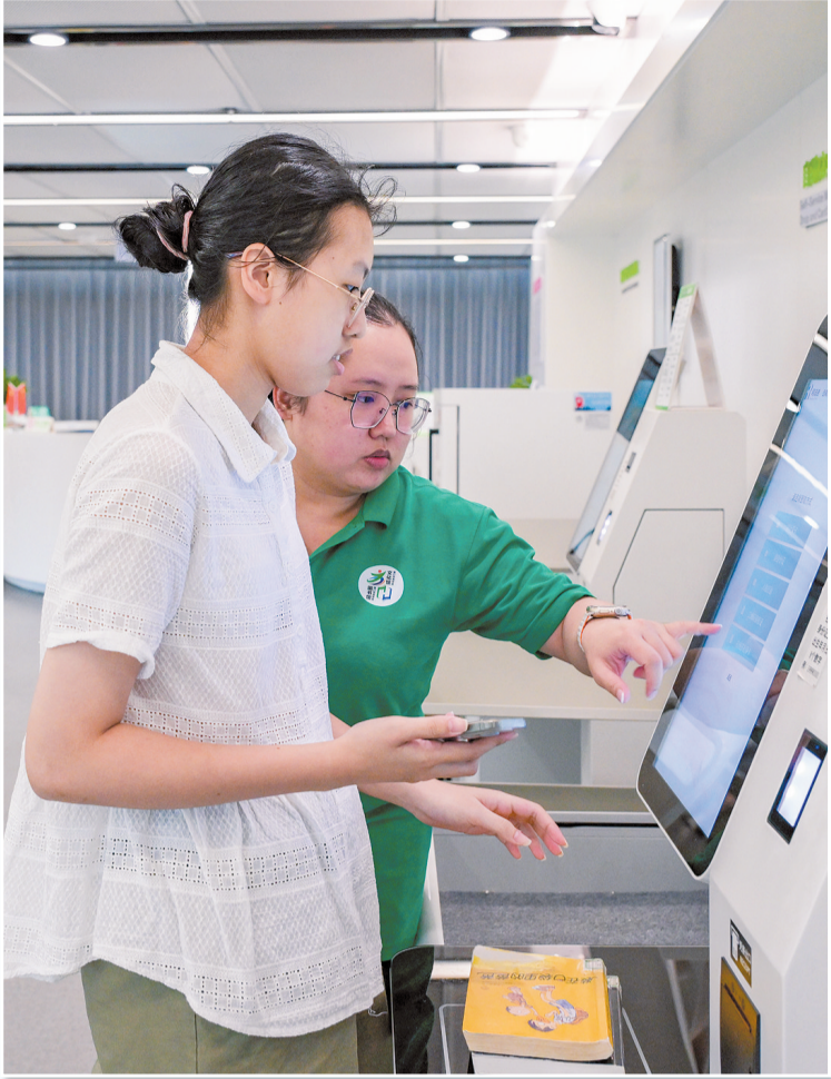
在龙华区图书馆,读者正使用“海易办”APP中的“金椰分”办理图书借阅。