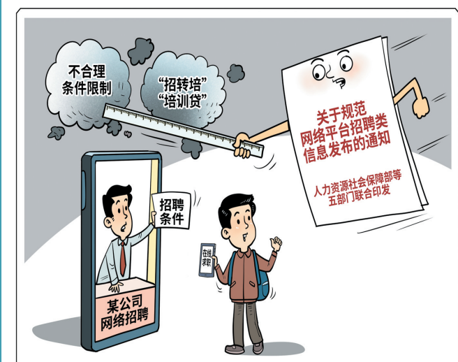
规范网络招聘秩序