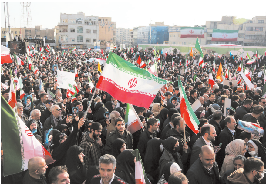
1月12日,在伊朗首都德黑兰,人们参加集会。当地时间1月12日下午2时,伊朗首都德黑兰及多个城市举行反对骚乱的集会。

专家认为,美国干涉伊朗政局的霸道行径,将严重威胁和破坏地区及世界稳定,如果动用军事手段,或将引发中东地区深层连锁效应。