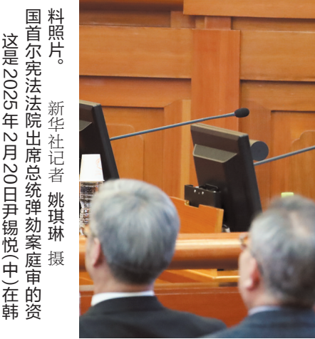
国首尔宪法法院出席总统弹劾案庭审的资 料照片。 这是2025年2月20日尹锡悦(中)在韩

新华社首尔1月13日电(记者黄莹莹 孙一然)韩国负责调查紧急戒严事件的特检组13日晚以涉嫌内乱罪要求法院判处前总统尹锡悦死刑。同案被告、前国防部长官金龙显被要求判处无期徒刑。