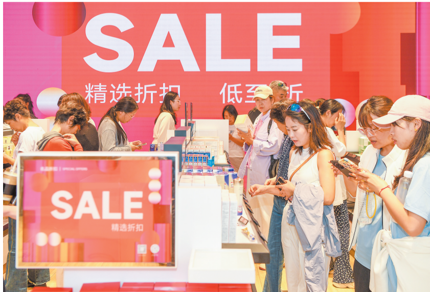
市民游客在cdf海口国际免税城选购免税商品。