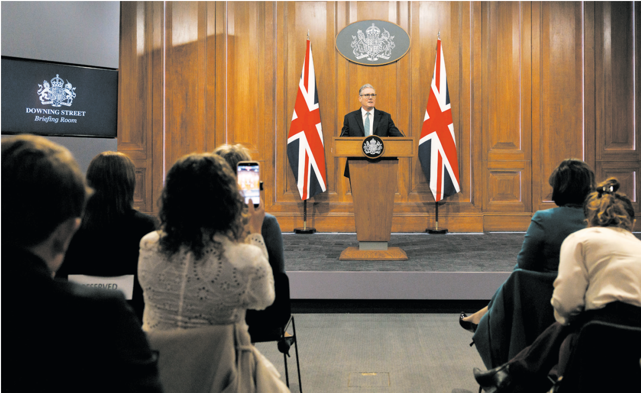
1月19日,英国首相斯塔默在伦敦举行的新闻发布会上讲话。英国首相斯塔默19日发表全国讲话表示,贸易战不符合任何一方利益,美国对盟友动用关税手段“完全是错误的”。

丹麦、挪威、瑞典、法国等八个欧洲国家近来因反对美国控制格陵兰岛而被美方威胁加征关税。这些国家18日发表联合声明,谴责美方做法“破坏大西洋关系,恐引发危险的恶性循环”,表示八国将“团结协调”予以应对。在美国国内,这一举措同样招致国会两党议员批评,引发对破坏与北约盟友关系的担忧。