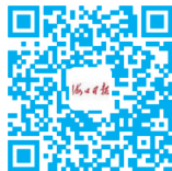
海口日报微信公众号 新闻随时看