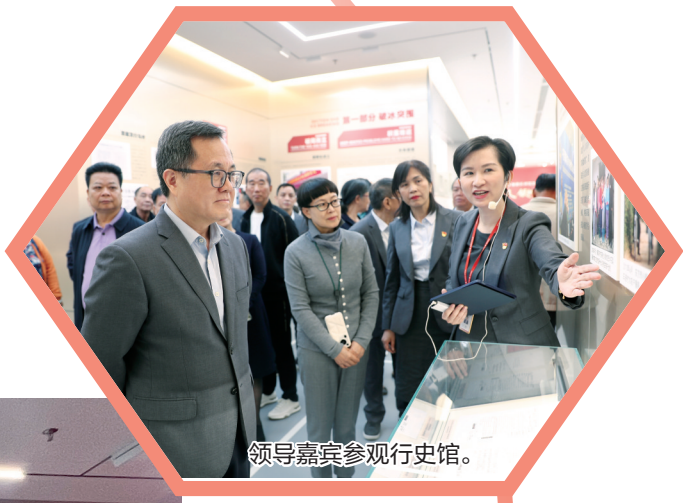
领导嘉宾参观行史馆。