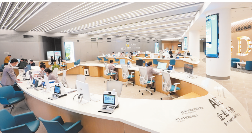
1月25日，在江东新区政务服务中心，不少企业、群众正在办理业务。