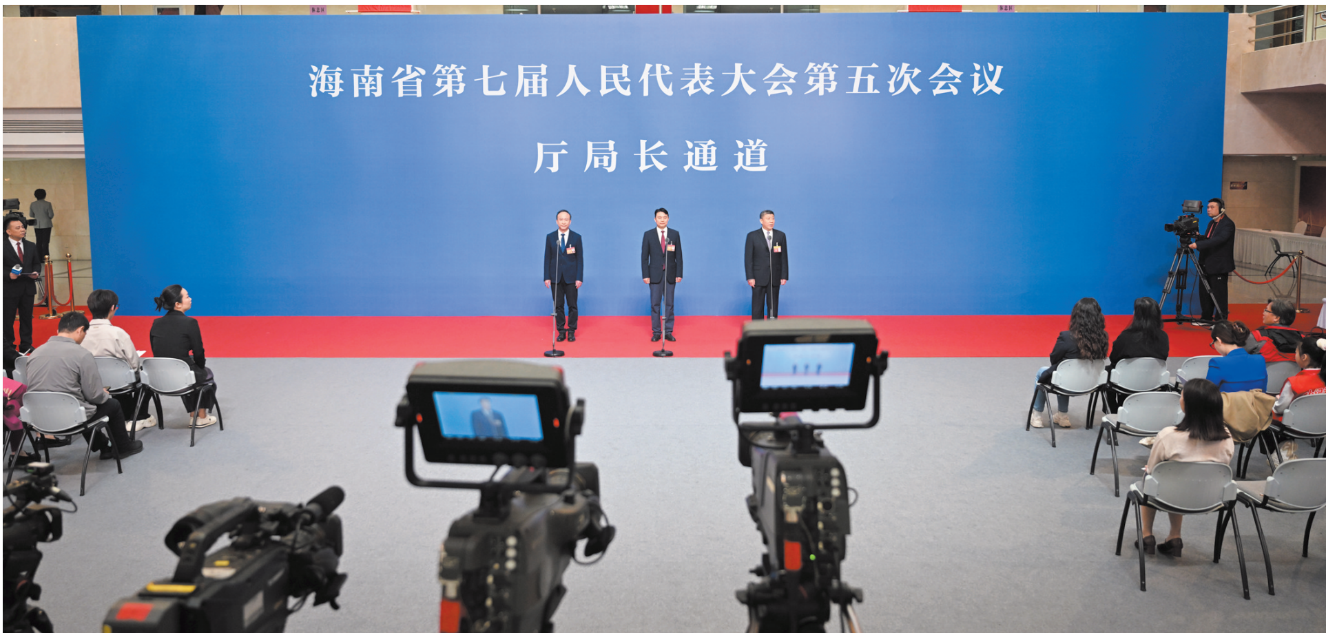
1月29日,海南省第七届人民代表大会第五次会议“厅局长通道”集体采访活动在海南广场举行。