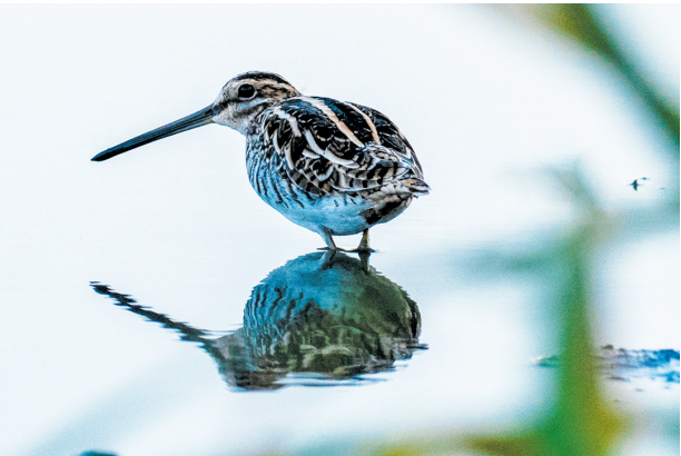
1月26日,在秀英区西秀镇龙头村栖息的候鸟沙钡。

2月6日清晨,在秀英区西秀镇龙头村的田间湿地,清脆的鸟鸣此起彼伏,打破了乡村的静谧。循着鸟鸣望去,成群的水鸟或在浅滩觅食,或振翅飞翔,勾勒出一幅灵动的乡村生态画卷。