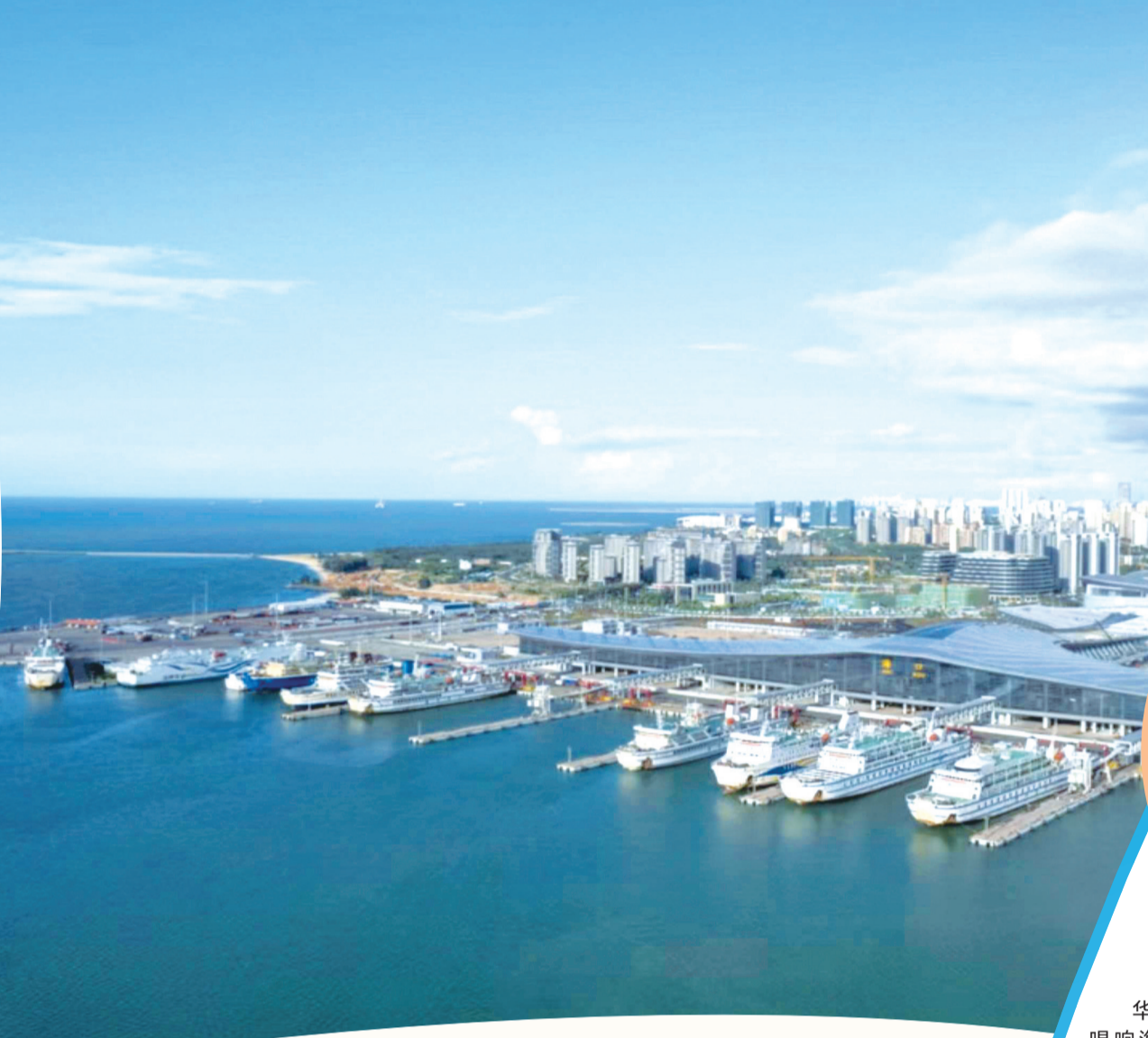
俯瞰的海口新海港犹如“鲲鹏”展翅。