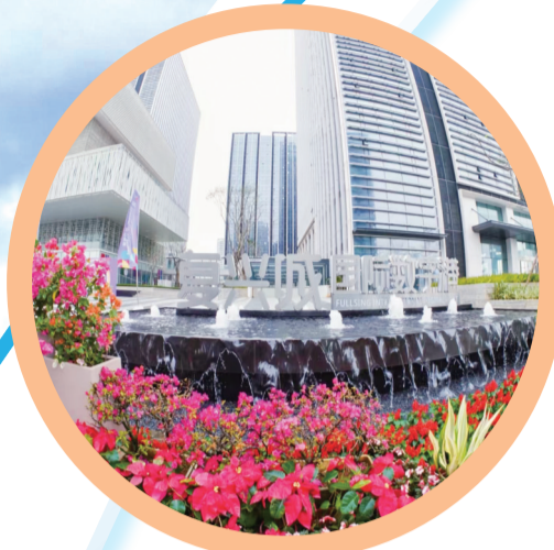
位于秀英区的海口复兴城国际数字港,数字经济产业蓬勃发展。