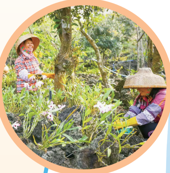
石山镇获评全国“两山”实践创新基地。

站在新的起点,秀英区将积极发挥海南自贸港北部门户双循环交汇点作用,高标准建设“自由便利开放之城”核心承载区,依托高新区、复兴城国际数字港做深“两个基地”,依托“三港两物流园”做实“两个枢纽”,依托总部企业资源做优“两个网络”,以高水平对外开放打造发展新优势。