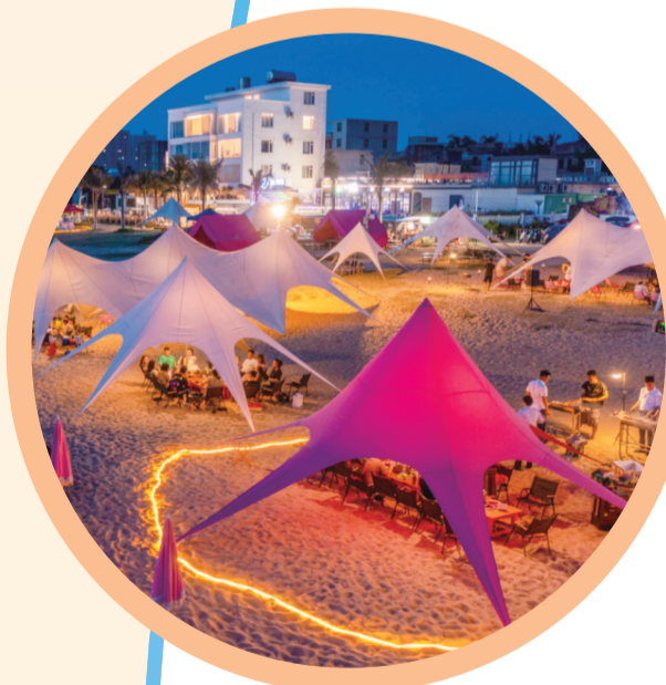
荣山寮村推动“渔业+文旅”融合发展,成热门打卡地。

“十五五”时期,秀英将高标准建设“产城融合创新之城”核心承载区,打造“五大经济圈”,构建五大支柱产业及三大特色产业梯次发展体系,重点联合高新区、复兴城国际数字港打造“海口药谷”国家级生物医药产业集群和数字经济千亿级产业集群。同时以“一城一场三馆一基地”为载体,高标准建设“时尚消费活力之城”核心承载区,以产业兴带动城市旺。