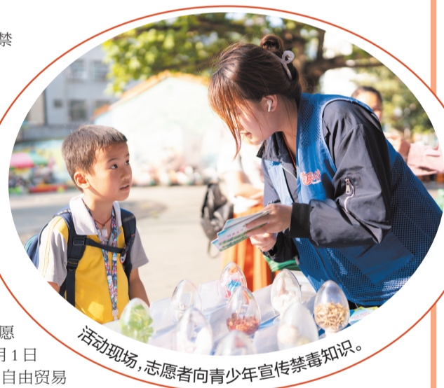
活动现场,志愿者向青少年宣传禁毒知识。

青少年识毒、防毒意识。”团龙华区委相关负责人介绍,此次活动是该区强化全民禁毒宣传、筑牢家庭防线的重要举措,覆盖群众超百人。