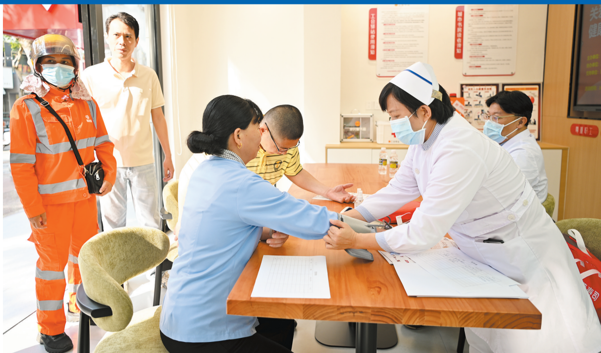
海口市职工服务中心工会驿站内,正在举办一场面向职工群众的中医诊疗活动。