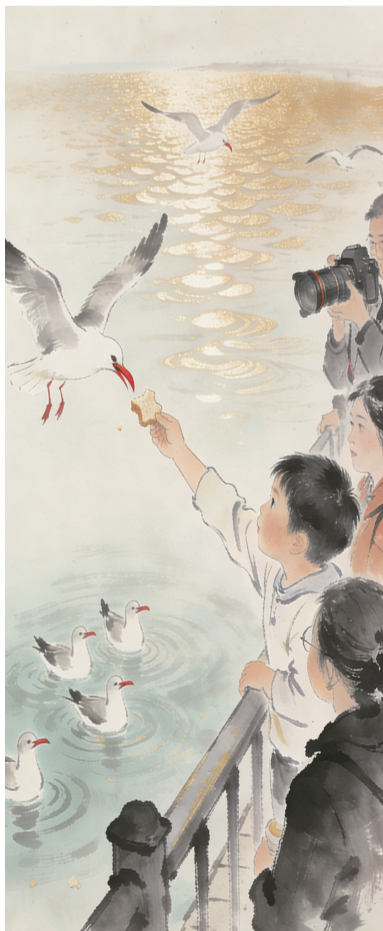
大洋使者 王发东 作

波光藏起它们的喘息 层层叠叠的金鳞的军阵里 埋伏着窥伺的红色鸟喙 面包的企图延伸孩子的臂展 人的渴求被暖风放大 在远离海洋的湖畔 相机总是不怀好意 是啊!谁愿收敛贪婪的翅膀 谁又在阻断春天的迁徙 这群大洋的使者是飞行在 春风里的指挥棒,围观者 潮水般冲刷着秩序的栏杆