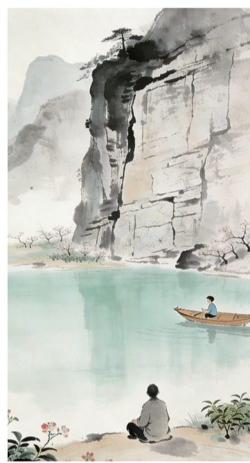
孤独的秋风 王发东 作

崖下端坐,向湖面壁 看青鱼布阵,茶花稀落 木船上的人,用镜头 比着我 秋风不打诳语 我有捧湖敬尔之意 美人失约,英雄久邀不至 空怀举杯之心 湖水又降了几分,不是我贪杯 是太阳小啣了几口 而这一湖碧波 始终铁青着脸色 仿佛我 ——愧对落日与朝阳