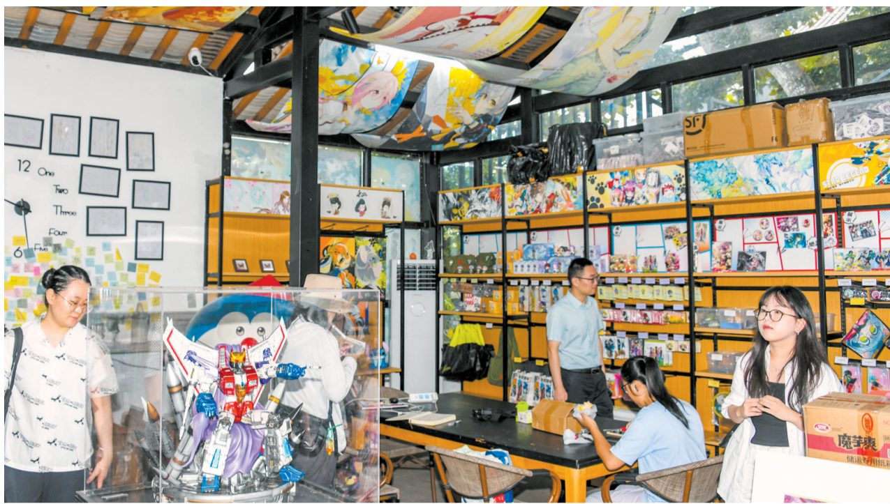
昌学村动漫气息浓厚,吸引不少市民游客到此参观游览。