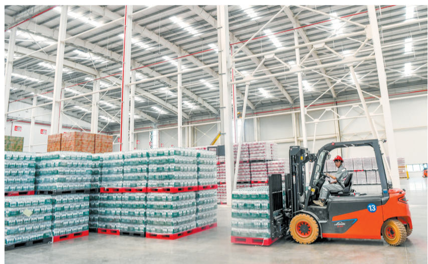
农夫山泉海南饮用水及饮料生产基地仓库内,工作人员驾驶叉车搬运产品。

本报4月2日讯(记者曾昭娟)4月2日,位于海口国家高新区的广东海南先进制造业合作产业园内,农夫山泉海南饮用水及饮料生产基地首条天然水生产线试生产工作正在加紧推进,首批产品已于3月31日下线。