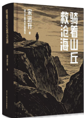
《骑着山丘救沧海》 作者:宋远升 出版社:浙江工商大学出版社

的。如《生煎活鱼》中“很少有人知道/多少年来/生活就一直这么煎熬”。这是独属于他的乡土生命比喻。某种意义上，我觉得他完成了从自发的诗写作者，到完全具有自觉意志的文学思想者的蜕变与升华。