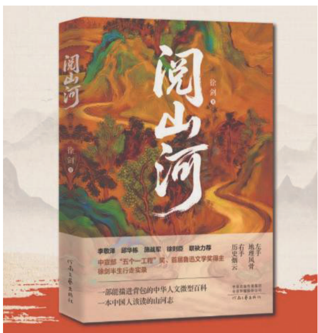
《阅山河》 作者:徐剑 出版社:河南文艺出版社

“归化心野，方得山河真意。”这是鲁迅文学奖得主徐剑在《阅山河》跋中的一句话，也是打开这部散文集的一把钥匙。徐剑以半生行走的结晶，为我们呈现一部“行走的中华人文微型百科”。这部散文集收录五十余篇作品，从“共一壶山水”到“睡城深似海”，不逐山水之奇，不恋风景之盛，将地理寻访、历史溯源、人物追忆与文化探寻熔于一炉，成为一部写给“在路上”的读者的人文读本。