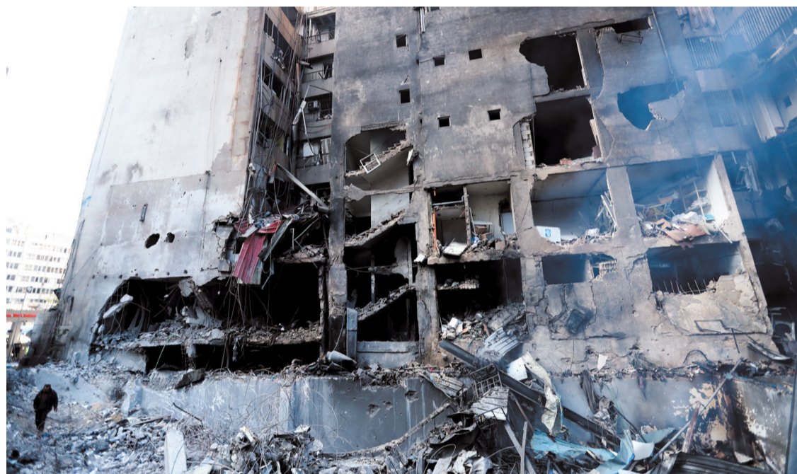
这是4月9日在黎巴嫩首都贝鲁特拍摄的遭以色列空袭摧毁的房屋。