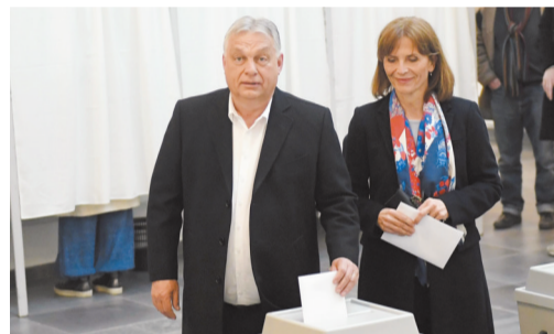
4月12日，在匈牙利首都布达佩斯，匈牙利总理欧尔班(左)和夫人在一起投票站投票。

新华社布达佩斯4月12日电(记者陈浩 刘艺炜)匈牙利国会选举投票于当地时间12日早6时(北京时间12日12时)正式开始。据匈牙利国家选举办公室数据，约810万选民可进行投票，选出匈牙利新一届国会议员。