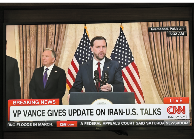
这是4月12日在巴基斯坦首都伊斯兰堡拍摄的美方代表团召开新闻发布会的电视画面。

摆在特朗普政府面前的战事升级选项可能有两个。一是大规模轰炸伊朗基础设施。特朗普此前曾威胁摧毁伊朗“每一座”桥梁和发电站。但美国学者早已警告，空袭无法摧毁伊朗政权，而大规模攻击伊朗基础设施势必引发伊朗强硬回击，将导致局势沿着“相互毁灭的阶梯”不断升级。