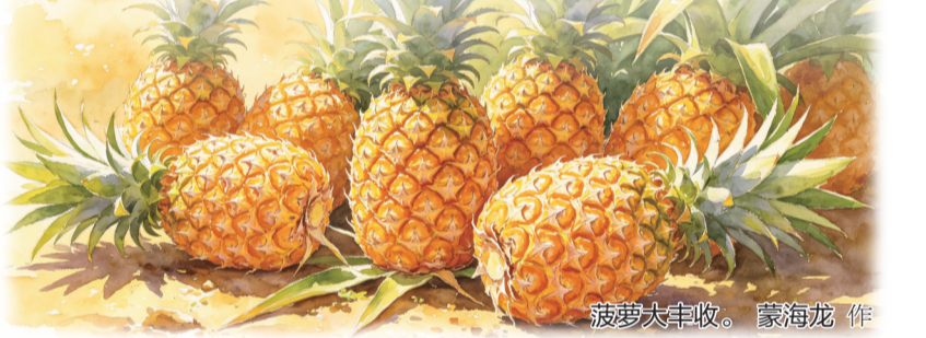
菠萝大丰收。 蒙海龙 作

风从玛珥湖面上飘过来，带着火山岩的微凉气息，拂过那片扎在水里的杉影。望着扎根在清波里的落羽杉，觉得它们是时光最温柔的守候。