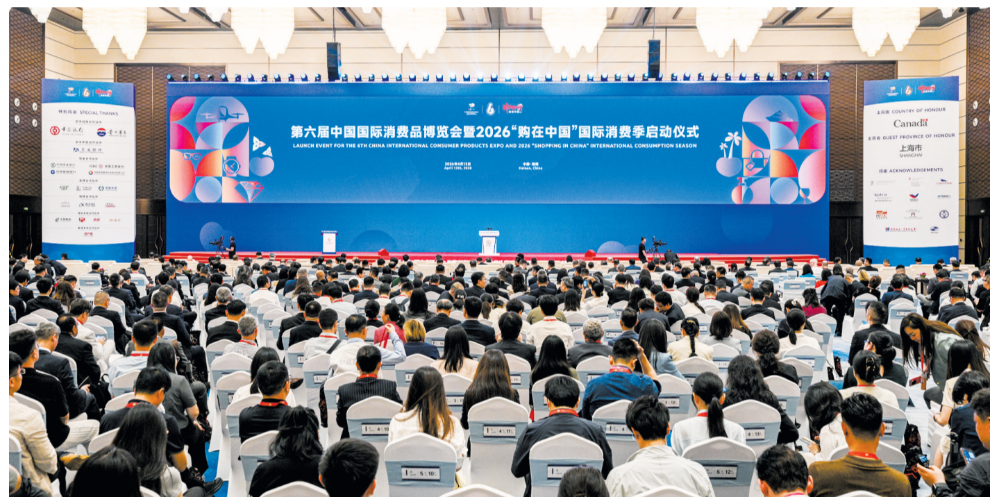
这是4月13日拍摄的第六届中国国际消费品博览会暨2026“购在中国”国际消费季启动仪式现场。

往,强化供需对接,与海南开展更宽领域、更深层次的贸易投资合作,促进互利共赢。海南将稳步扩大制度型开放,深入推进商品和要素流动型开放,全力打造市场化、法治化、国际化一流营商环境,为各位嘉宾与客商参展、投资、兴业提供全方位高质量保障。