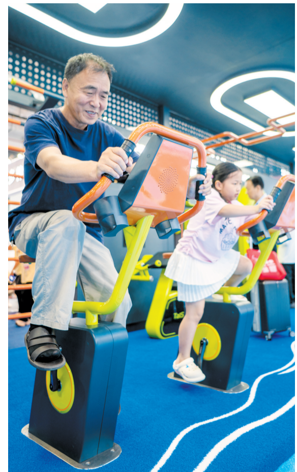
4月16日,观众在泰山体育展台体验智能健身单车。

外场非遗集市上,“天才妈妈”及海南创业女性作品吸引了众多观众,非遗主题时尚秀、器乐演奏等展演精彩纷呈。省妇联相关负责人表示,将持续深化“自贸她创”品牌,搭建交流平台,传播女性故事,为自贸港建设贡献“自贸她创”。