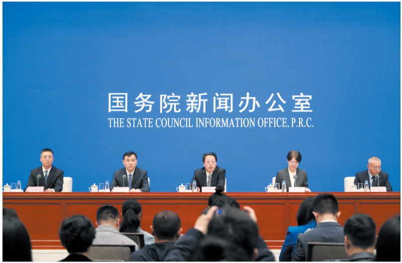
国务院新闻办公室 THE STATE COUNCIL INFORMATION OFFICE. P.R.C.

4月17日,国务院新闻办公室在北京举行“开局起步‘十五五’”系列主题新闻发布会,国家发展改革委副主任王昌林、发展战略和规划司司长陈雷、低空经济发展司司长郑剑、产业发展司司长傅久岭介绍“十五五”时期推动经济社会高质量发展有关情况,并答记者问。