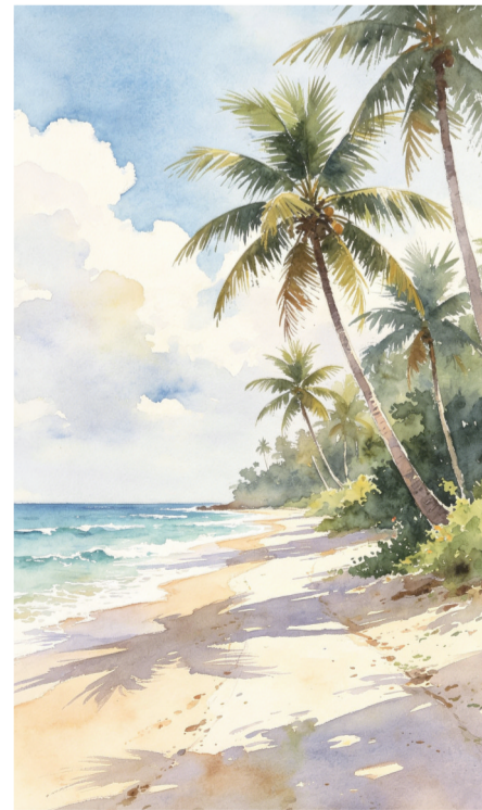
海边椰林路。蒙海龙 作