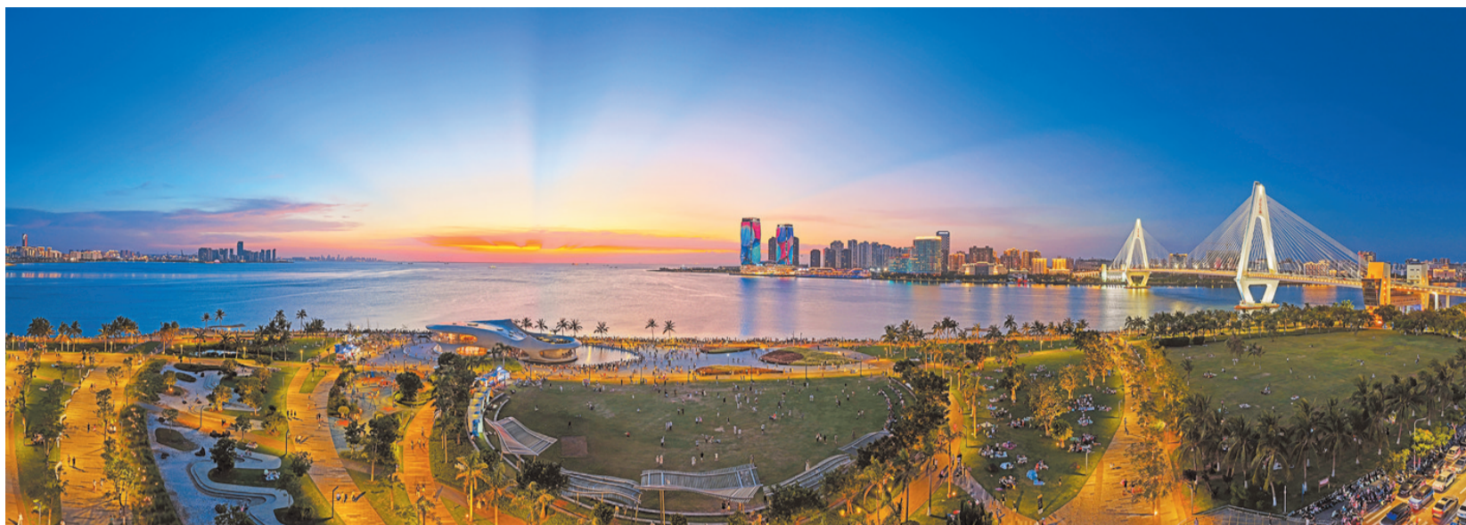
海口湾一带。

散文诗的文体，本质是诗歌。而诗歌必须要有诗意之美，可歌咏，可音乐，可抒情。在《椰风或潮声》中，这种特点，得到很好的张扬。在《钱铃双刀舞》《黎山三月三》等章中，其场景、画面、韵律、节奏，都把控得灵动而有度。那些抑扬顿挫节奏感强的诗句，引领我们进入诗人所写的现场。诗中有饱满的诗意，浓烈的情感，句子凝练生动，呈现方式撼人心魄，不但将音乐性与抒情性完美结合，可歌可诵，也让人捧卷而深思。在《椰风或潮声》中，写到“珍禽与树木繁茂的天籁”“异兽与花草的幻美童话”“奇石与老藤的绵亘史话”“感受着大自然的魔力密码，聆听着大山的的神奇心声”，等等这些，诗人运用意象与