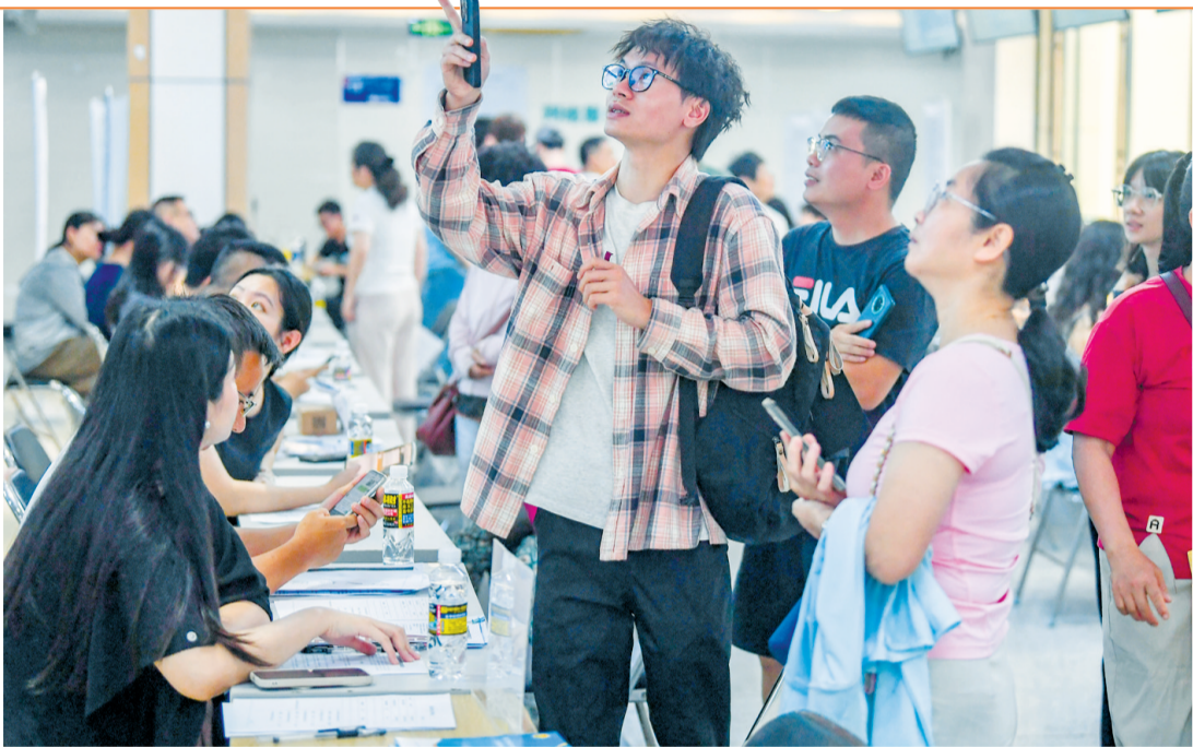
4月28日,2026年民营企业服务月专场招聘会在海口市人力资源开发局一楼大厅举办。本报记者 苏强坤 摄

本报4月28日讯(记者陈卓卓 通讯员王定明 刘晓华 李云兴 张培)近日,粤桂琼“北部湾联通-2026”人民防空跨区支援演训在海南海口、文昌、琼海、陵水、昌江等6市县同步举行,来自广东、广西、海南三省(区)34个市县的人防部门及相关专业分队近600人,围绕跨区域机动支援、指挥通信组网等多个核心课目展开演训。演训中,粤桂两地人防专业力量接到支援指令后,迅速奔赴海南,与海南人防专业力量混编成联合处置小组,搭建起统一的指挥调度平台,构建了“空地一体、多网互补”的立体化通信保障网,实现了指令一键下达。在海口演训现场,烟雾伪装分队采取烟雾遮挡的方式实施遮蔽干扰,对指挥所进行伪装防护;物资投送无人机穿透烟雾,抵近目标,完成空缺物资精准投送;无人机组群分队在可能遭敌袭击方向,设置不同方位的蜂群编队,形成多层、多元组合布防态势。在文昌商业航天发射场,空中警戒组起飞无人机,进行低空空域侦察监控,建立多维度立体防护网。在陵水某基地,水下探测分队迅速前出,对水下监测设备实施24小时不间断巡检。在昌江某发电站,辐射监测专业队收集、分析辐射数据,划定污染区域,组织隔离防护。在琼海博鳌机场,消防分队第一时间控制住火情,医疗救护分队高效开展检伤分类、现场急救和转运后送。此次演训在海南6个市县同步实施,重点围绕机场、电厂、基地等重要设施防护,组织跨海机动和岛礁投送通信保障,持续深化人民防空行动的组织与实践,进一步锤炼战斗意志,夯实能力基础,优化协同机制。据了解,“北部湾联通”人民防空跨区支援协同训练已成功举办五届,成为粤桂琼人防系统深化协作的重要平台和品牌演训活动。