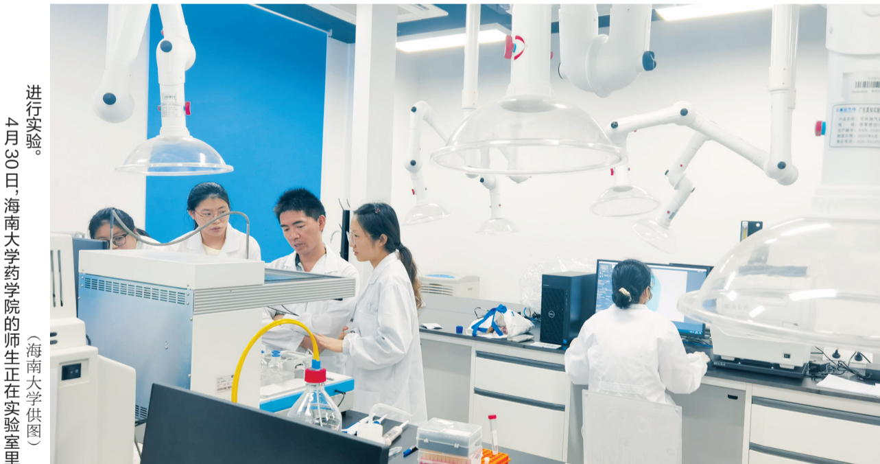
进行实验。4月30日,海南大学药学院的师生正在实验室里。

海南大学相关负责人表示,下一步该校将在原有专业外,新设临床医学、生物医学科学、时空信息工程等本科专业,推动学科布局与产业发展精准对接,并将人工智能融入教学全过程。同时,聚焦南药聚药、海洋药物等海南特色领域,打造基础研究、新药研发与社会服务深度融合的学科体系,为海口产业高质量发展持续输送高层次人才。