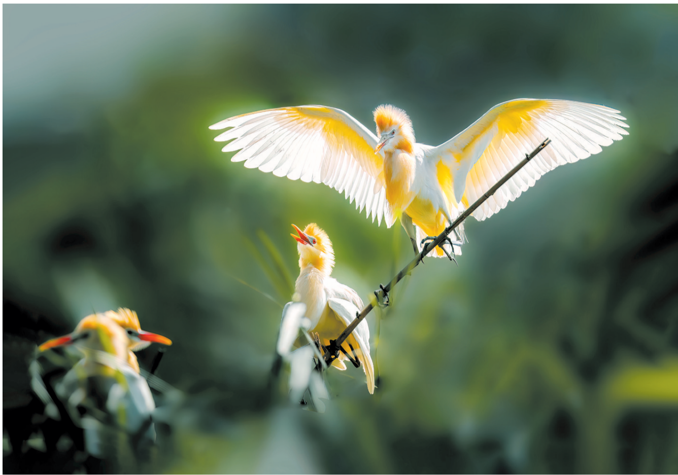
翠影金姿。符德勇 撰