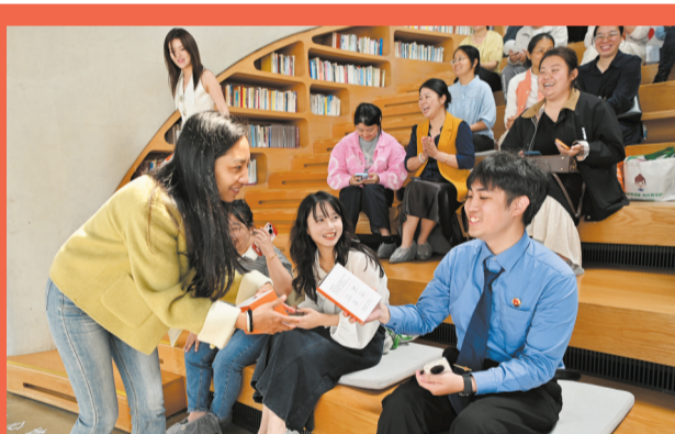
2026年“云洞·青年说”龙华微宣讲现场,嘉宾(图右)参与扫码游戏互动赢得奖品。