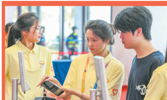
第六届消博会,“小椰青”志愿者引导观展人员进入场馆。