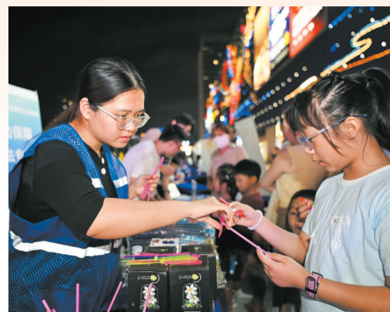
▲秀英区五四青年节主题活动中,参与互动活动的市民领取奖品。