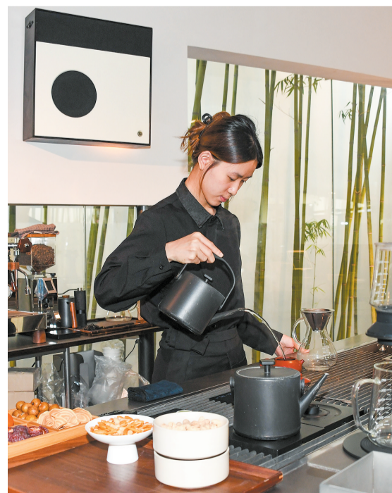
新中式茶饮店“肆意茶聊”,以雅致空间营造沉浸式品茶体验,成为年轻人相聚交流的热门据点。