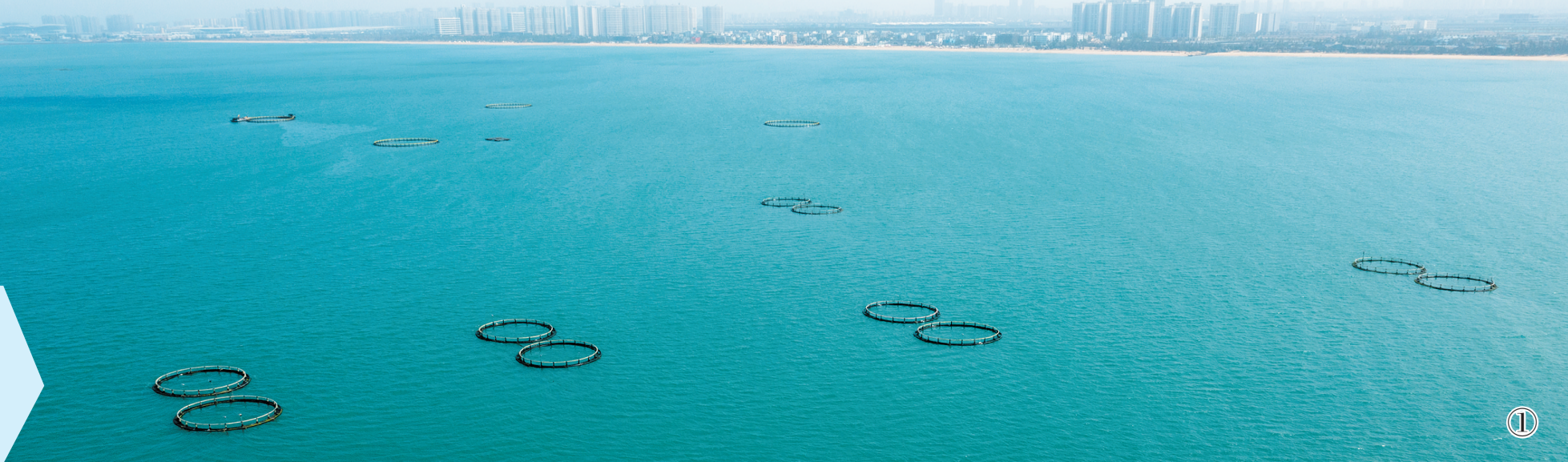
①秀英区荣山寮村西侧的海域上，一排排 深水网箱在蔚蓝色海面整齐列阵。