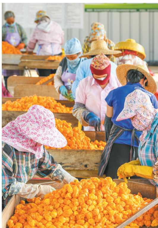
▲遵谭镇龙合村黄灯笼辣椒种植基地里， 农户们正在分拣黄灯笼辣椒。

琼山区也依托生态水田资源，大力推广稻虾共生立 体种养模式，让闲置撂荒地变身增收良田。凭借海南特 有的气候优势，海口小龙虾每年11月至次年3月错峰上 市，精准填补省外市场空白期，品相优良、销路紧俏。如 今，琼山区甲子镇、大坡镇、云龙镇的稻虾种养面积已近 千亩，该区红旗镇还探索出“藕虾轮作”的衍生模式，进 一步丰富热带特色种养业态。“稻虾共生立体种养让土 地‘一季水稻两造虾’，‘一田三收’让亩产超万元。”琼山 区小龙虾产业科技协会会长冯汉勇介绍。