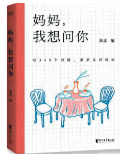
《妈妈,我想问你》 作者:果麦 出版社:浙江文艺出版社

“小时候你是什么发型?你喜欢吗?”“那时候有没有什么零食?”“你第一次出远门是什么时候?”“你收到过情书吗?”……我们习惯了母亲的守护与付出,却常常忘了,她除了是“妈妈”,更是一个有过青春、梦想、迷茫与遗憾的独立个体。果麦编著的《妈妈,我想问你》,以349个精心设计的问题为桥梁,打破这份隔阂,引导成年子女与母亲进行平等深度的对话,为每个家庭留存下无可替代的亲情感。