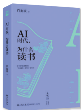
《AI时代,为什么读书》 作者:邝海炎 出版社:九州出版社

至于谈到读书法则,他认为没有什么“放之四海而皆准的读书方法”,因人而异,但总的原则是,要把泛读与精读有机结合起来,边读边想。同时,他还主张读书时最重要的是能“读进去,读出来”。所谓“读进去”,就是能读下去、读懂书,但一味沉迷于其中走不出来也不行。“读出来”就是能从书中思考出一些道理,形成自己的思想观点,而不仅仅是对书中的内容称赞不已,如此也就领略到了读书的深邃要义。相信读者能在本书的指引之下,收获阅读的快乐。