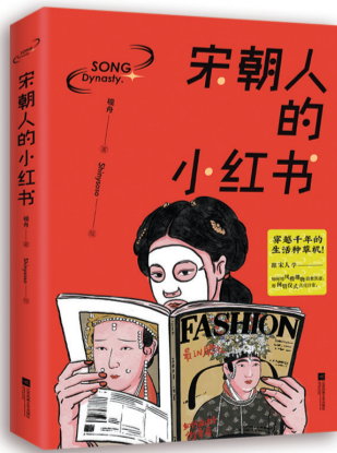
《宋朝人的小红书》 作者:砚舟 出版社:江苏凤凰文艺出版社

《宋朝人的小红书》读起来轻松但不浅薄,尽管风格很潮,但内容考据扎实,真可谓千年前的“生活种草机”,处处可见宋人生活的烟火气和风雅韵味。