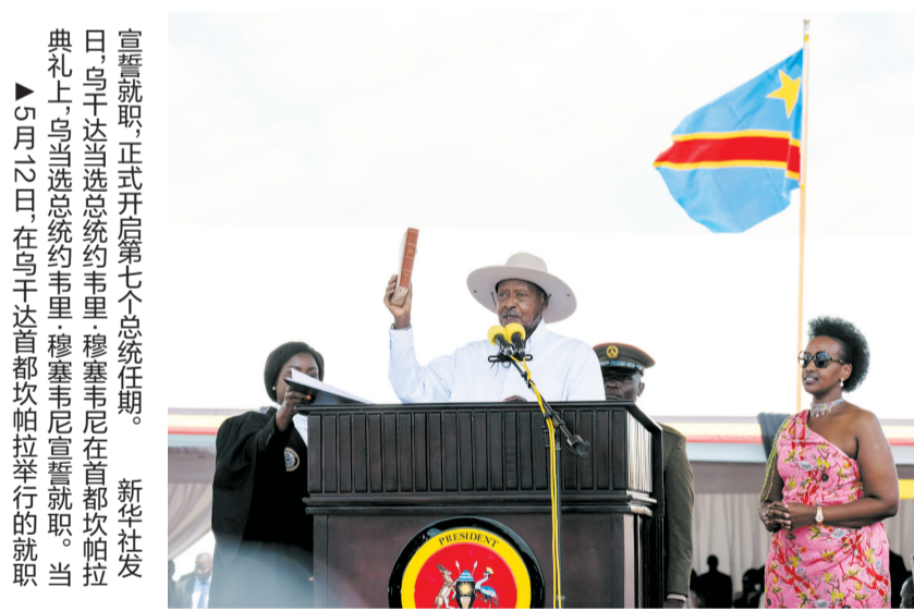
宣誓就职,正式开启第七个总统任期。