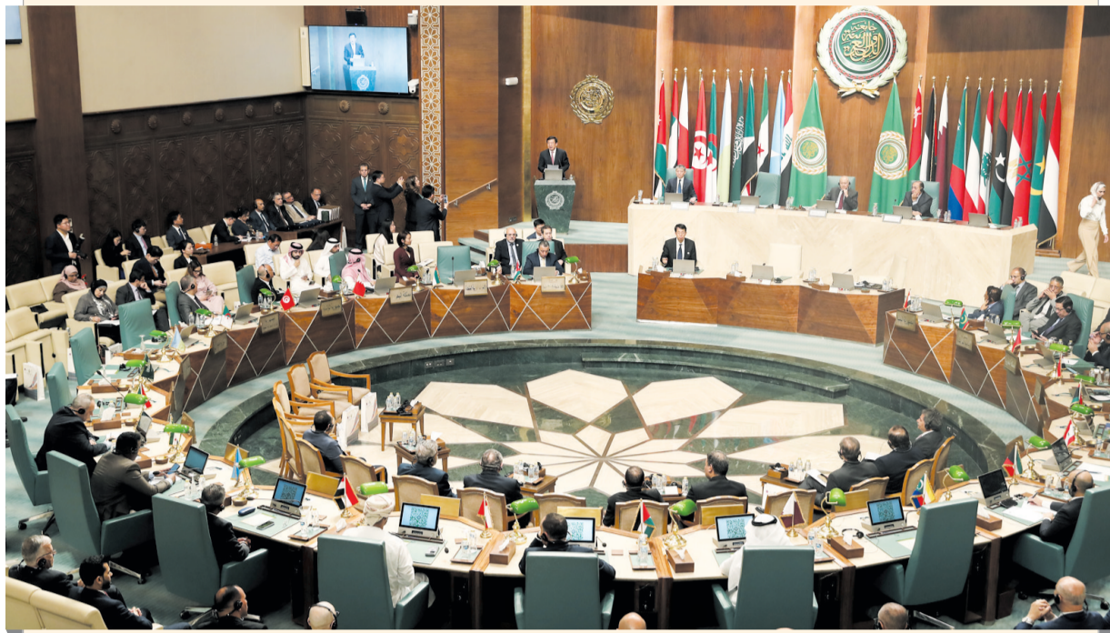
5月12日,以“聚媒智 启新程——携手构建中阿命运共同体”为主题的“全球南方”媒体智库高端论坛中阿伙伴大会在位于埃及首都开罗的阿拉伯国家联盟(阿盟)总部开幕,来自中国和阿拉伯国家约110家媒体、智库、政府机构、企业及国际和地区组织的约250名代表出席。

■近年来,全球南方这一概念在国际舆论场中的影响力与重要性日益凸显,相关议题在国际场合的关注度和讨论度呈现明显上升态势。新华社记者借助大数据工具,对全球3119家媒体2023年1月至2026年3月涉全球南方报道中高频出现的词汇进行梳理提炼。结果显示,全球南方正成为驱动全球经济增长的重要引擎、推动世界多极化进程的关键动力和应对全球性挑战的重要力量。全球南方合作的领域和模式也在快速多元化,以包容并蓄、互利共赢为特征的南南合作在贸易、投资、金融、科技、能源等领域不断开花结果。