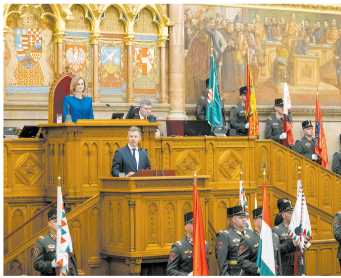
政府12日在国会宣誓就职。