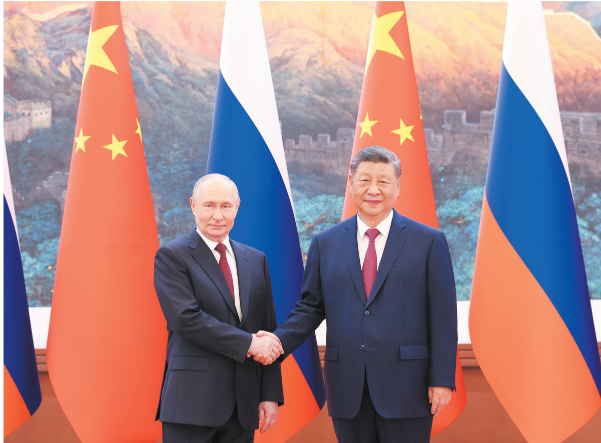
5月20日上午,国家主席习近平在北京人民大会堂同来华进行国事访问的俄罗斯总统普京举行会谈。

新华社北京5月20日电(记者杨依军 温馨)5月20日上午,国家主席习近平在北京人民大会堂同来华进行国事访问的俄罗斯总统普京举行会谈。两国元首一致同意《中俄睦邻友好合作条约》继续延期。