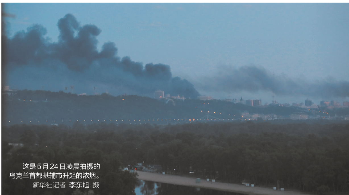
这是5月24日凌晨拍摄的乌克兰首都基辅市升起的浓烟。

新华社莫斯科/基辅5月24日电 (记者许炜凯 李东旭)俄罗斯国防部24日说,俄军当天对乌克兰发起大规模报复性打击。乌方说此次俄军空袭已造成4人死亡、83人受伤。