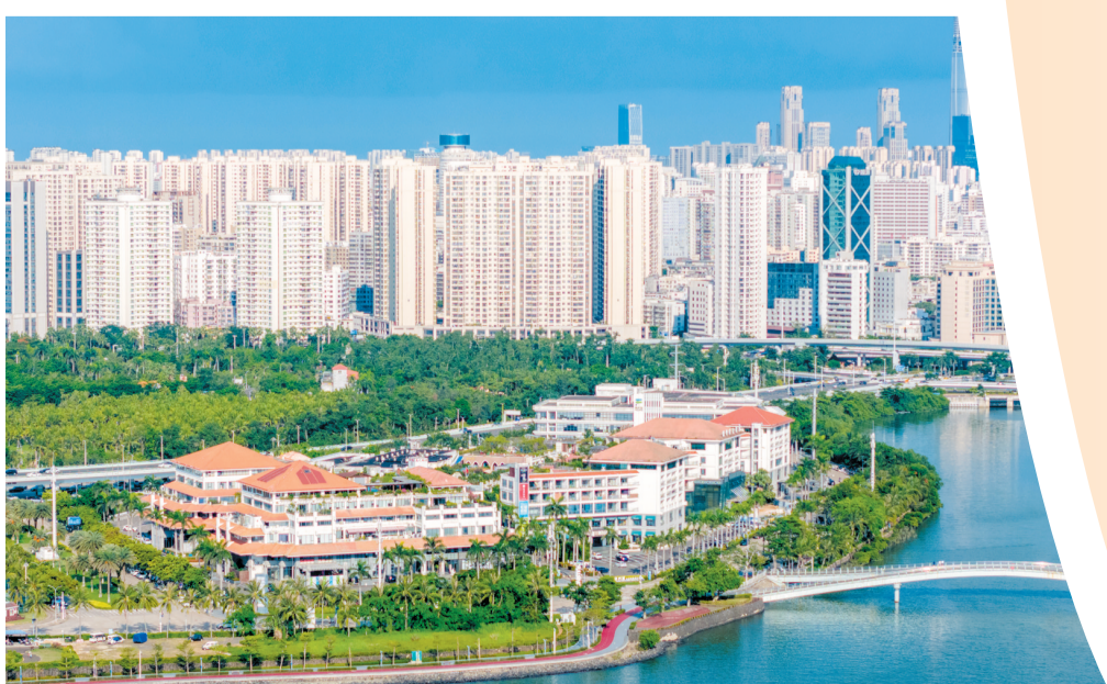
▲航拍海口复兴城互联网信息产业园。

柳城逐新,生机勃勃;科创潮涌,动能澎湃。 高标准建设海南自贸港核心引领区和“六个之城”,其中,打造产城融合创新之城是强市之基。 当前,海口按照“以产兴城、以城聚人、以人促产”思路,因地制宜优化产业空间布局,着力构建具有海口特色和优势的现代化产业体系,推动科技创新和产业创新深度融合,强化招商投资促进,实现产业升级与城市能级跃升。