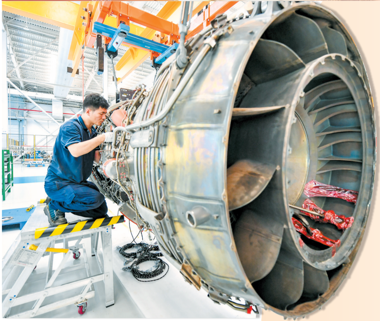
▲在海口美兰空港吉耐斯航空发动机维修工程有限公司,工作人员检修航空发动机及零部件。