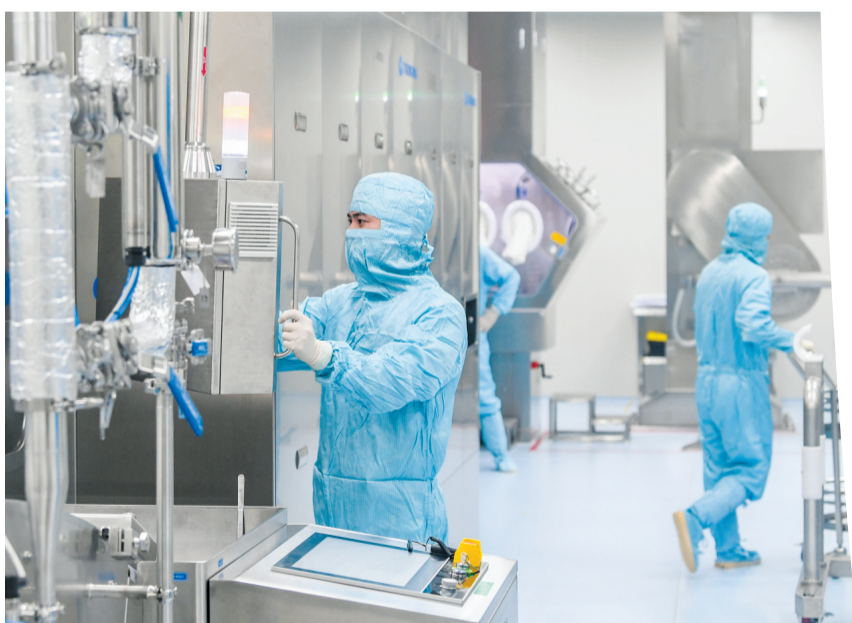
▲在位于海口美安生态科技新城的海南海灵化学制药有限公司美安基地生产车间内,工作人员正在进行洗瓶操作。