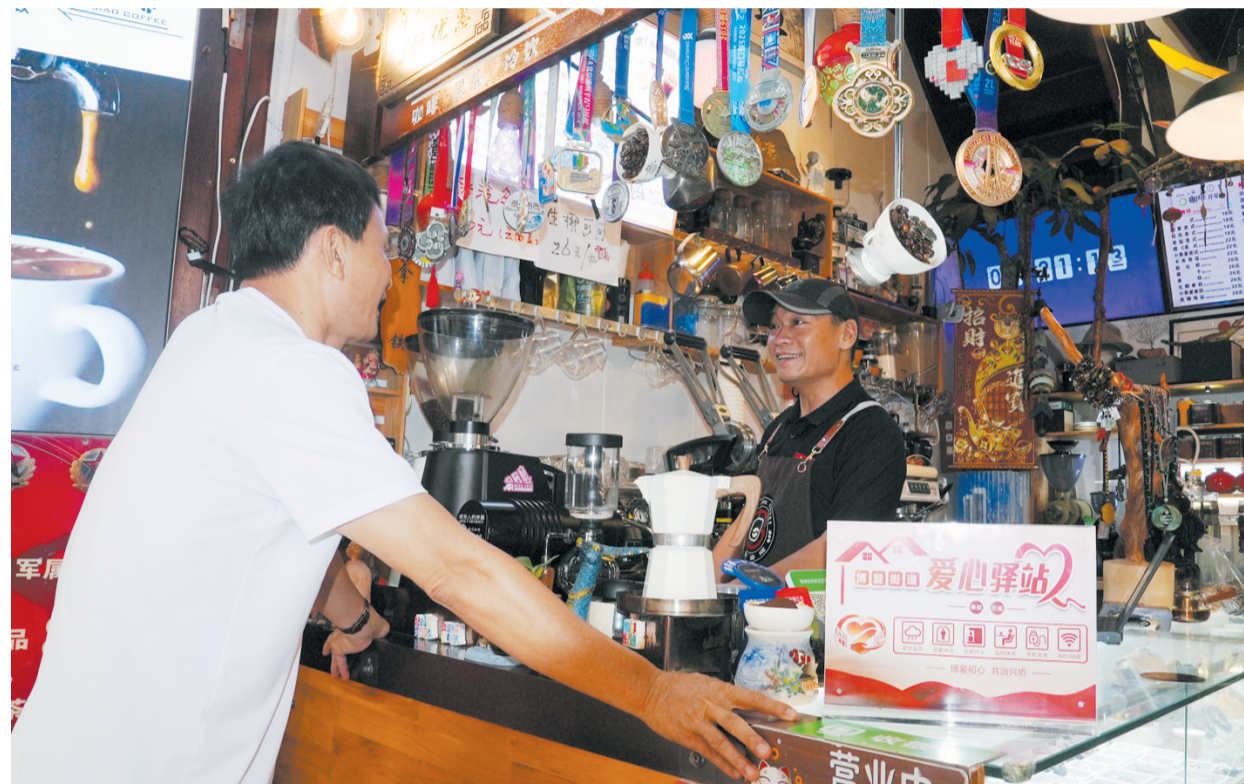
骑楼老街打铁巷的弘角咖啡店经营有声有色,顾客络绎不绝。

作为海口的城市地标、文旅名片,骑楼老街常年客流不息、游人如织。为进一步补齐服务短板、盘活商圈资源,今年美兰区博爱街道打造了“博爱初心·共治兴坊”党建品牌,构建起街道统筹牵头、职能部门联动、社区属地管理、商户协同共治的立体化组织体系,并以组织共建、事务共商、资源共享、难题共解为工作机制,凝聚多方治理力量、激活街巷内生动能,全力推动骑楼商圈提档升级、焕发全新生机。