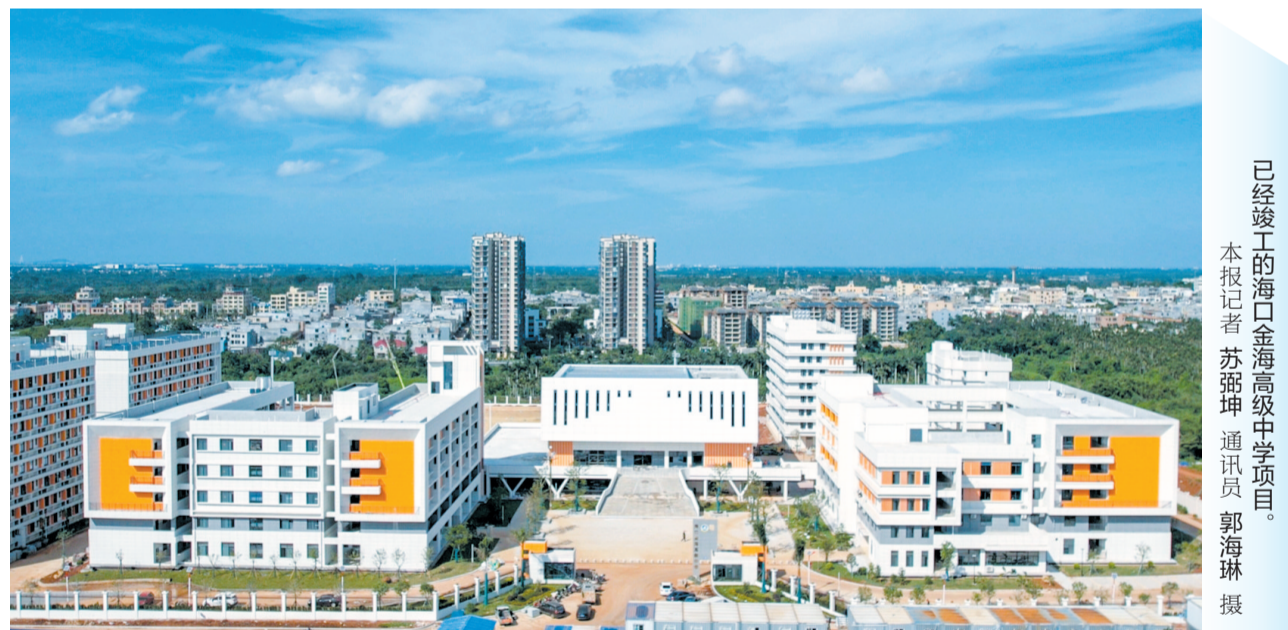
已经竣工的海口金海高级中学项目。

本报5月27日讯(记者龙易强 特约记者许晶亮)近日，位于琼山区云龙镇C0901地块的海口金海高级中学项目顺利竣工。学校将于今年9月1日开学，计划招收高一新生300名。