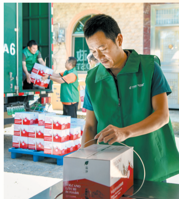
永兴镇吴洽村清愿荔枝王供应链场内，海口邮政工作人员在打包搬运荔枝。

5月25日，在五田家福稻核心种植区域，金灿灿的稻田翻滚着层层稻浪，水稻收割机来回穿梭作业。(下转02版)