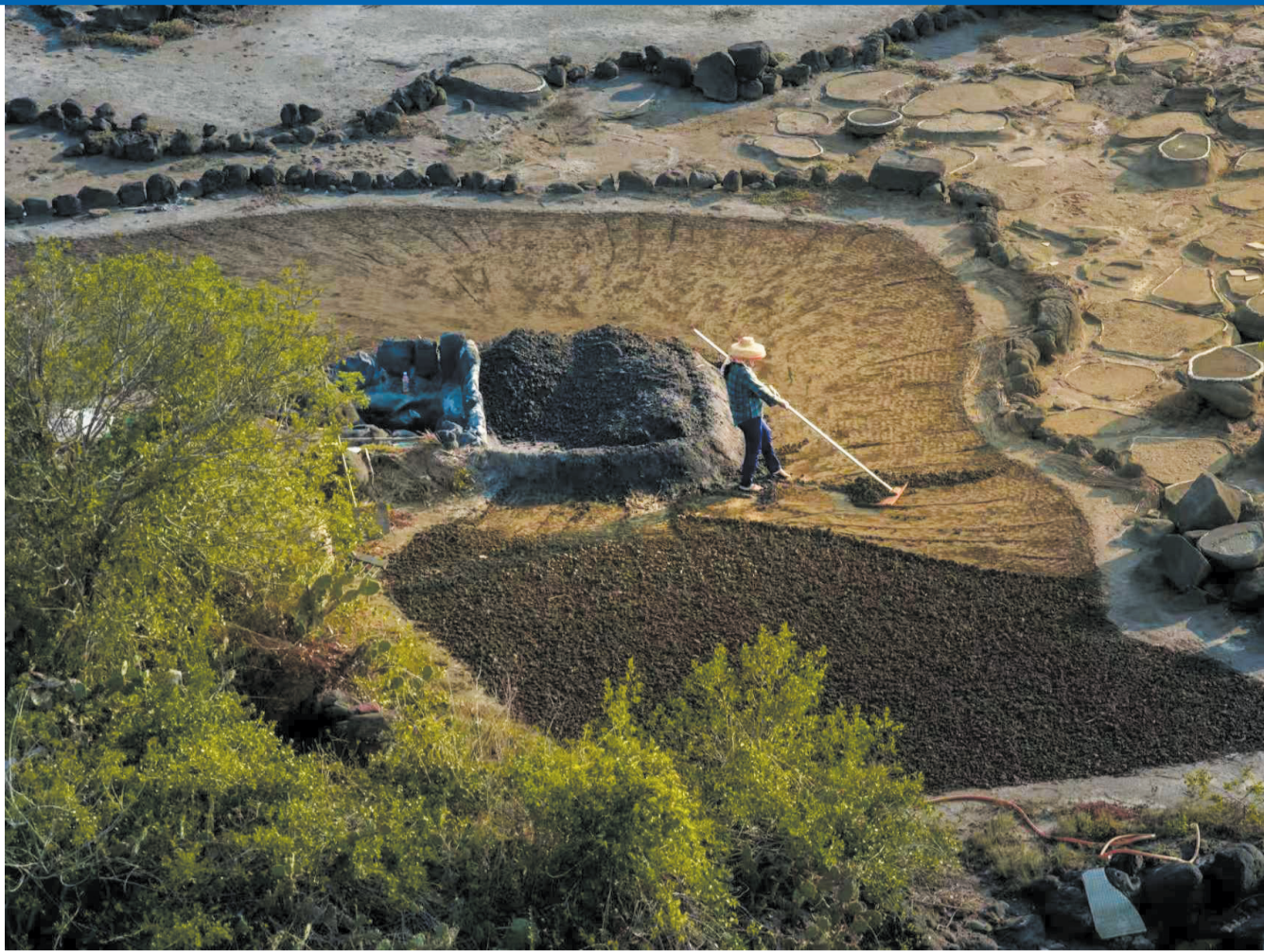
古盐田里的耕耘。郭小红 摄