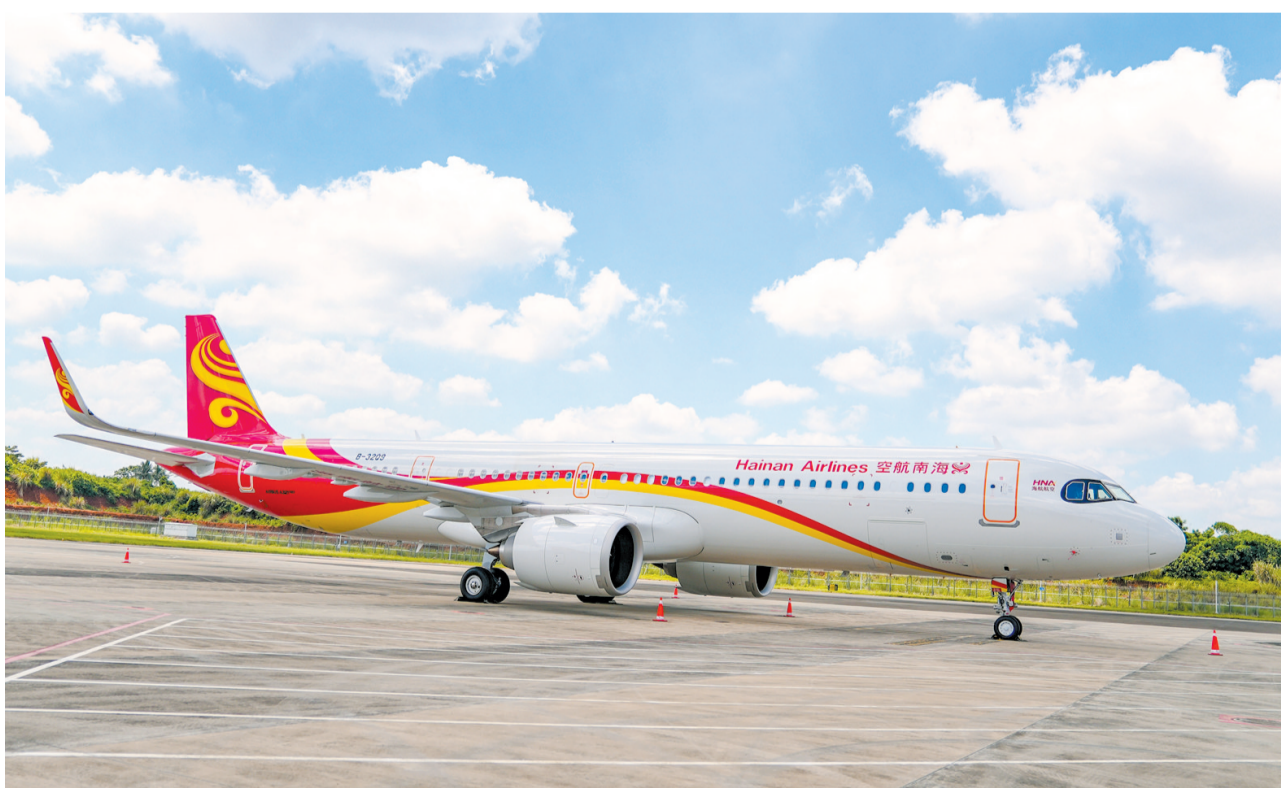
5月29日，海南航空新引进的空客A321-251NX型飞机，正停在海口美兰国际机场停机坪。