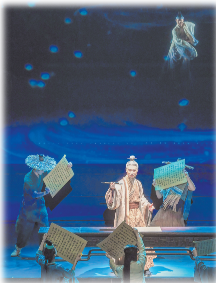
▲▼由海南省演艺集团制作的中国首部AI概念国风音乐剧《心安东坡》剧场版在海口成功首演。