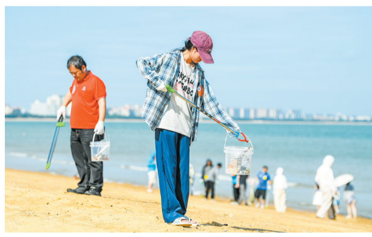
6月6日,在海口市秀英区荣山寮村海岸线,志愿者正在捡拾垃圾。

按照“无废海湾”建设标准,现场实行规范化闭环处置模式,所有清理出的垃圾统一归集、分类打包,由环卫部门统一清运处置,严格落实垃圾分类与源头减量要求,让生态保护举措落地见效。跨区域、多部门的协同联动,有效汇聚起陆海统筹、同心共治的强大合力,生动展现了联防联控