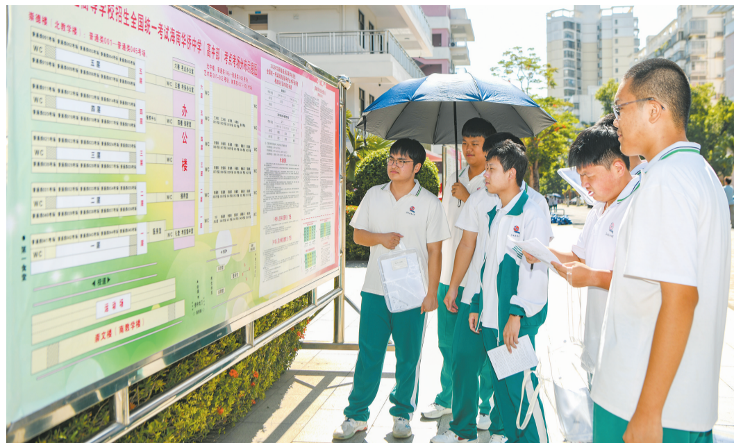
6月6日,在海南华侨中学(高中部)考点,考生正在查看考场分布图和注意事项。

记者走访看到,截至6月6日上午,全市各考点筹备工作全部完成。海南农垦中学考点已搭建遮阳篷,拉起警戒线,筑牢安全防护防线。海口海港学校考点外摆放高考温馨提示、禁行时间、泊车指引等标识,同时设置“高考加油”卡通打卡点,营造暖心励志的备考氛围。海口市第一中学高中部考点外,交警、环卫等多部门已到岗,开启护考工作模式。该考点副主考陈文彩介绍,考点提前对接相关部门,细化交通疏导、环境保洁、秩序维护等保障举措,全力为广大考生营造安全、安静、舒心的应试环境。